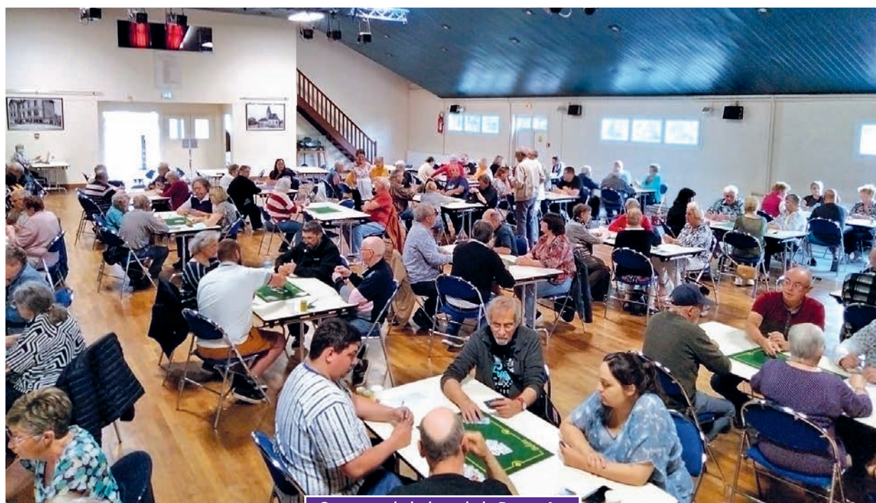
Concours de belote de la Pentecôte